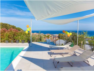
Appartementencomplex Zwembad Strand